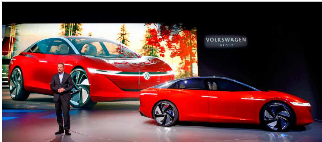
Herbert Diess, presidente de Volkswagen, presenta el I.D. Vizzion, un modelo 100% eléctrico que en 2025 será autónomo de Nivel 5.