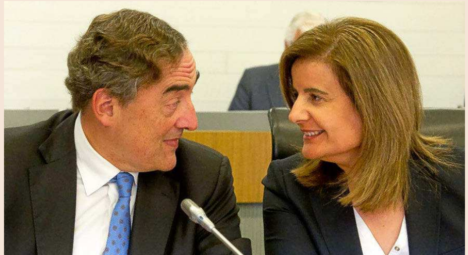
El presidente de CEOE, Juan Rosell, con la ministra de Empleo y Seguridad Social, Fátima Báñez.

En este sentido, CEOE recuerda que su Comisión de