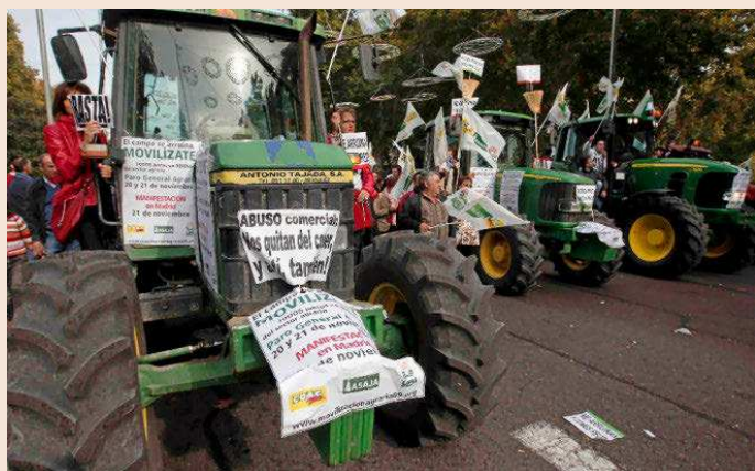
Una de las manifestaciones de agricultores que proliferaron durante la crisis y que hoy vuelven a Madrid.