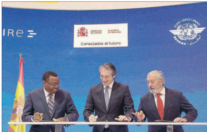
El ministro de Fomento, Í. de la Serna, junto a O. Benard, presidente del Consejo de la OACI y el secretario de Estado.

Así, desde Fomento ya están trabajando para asegurarse de que los ahorros generados por los ajustes