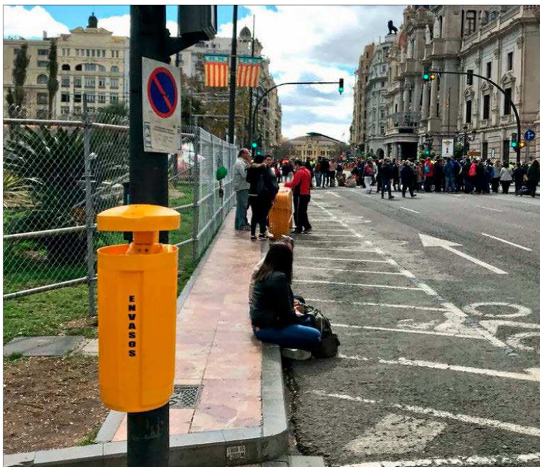
Una de las nuevas papeleras para envases que se ha ubicado en el entorno de la 'mascletà'.

ses para introducir este punto y así se lo ha hecho saber ya al Ministerio de Medio Ambiente. En principio, el Ejecutivo aspira a sacar adelante la reforma antes de que finalice esta legislatura, aunque el ente gestor