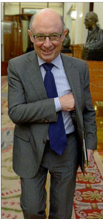
El ministro de Hacienda, Cristóbal Montoro.

«Tendremos plazo para decidir las inversiones, licitarlas y seguramente ejecutarlas. Para generar la actividad, para que los ciudadanos lo disfruten y, digámoslo también,